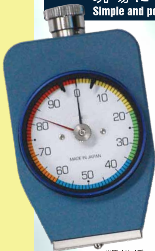
※原寸サイズ actual size

現場に携帯可能な簡易型測定器 Simple and portable mold hardness tester for easy on-floor-testing.